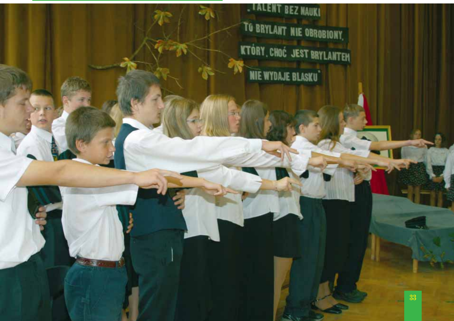
Młodzi gimnazjaliści • Young high-school students • Junge Gymnasialisten