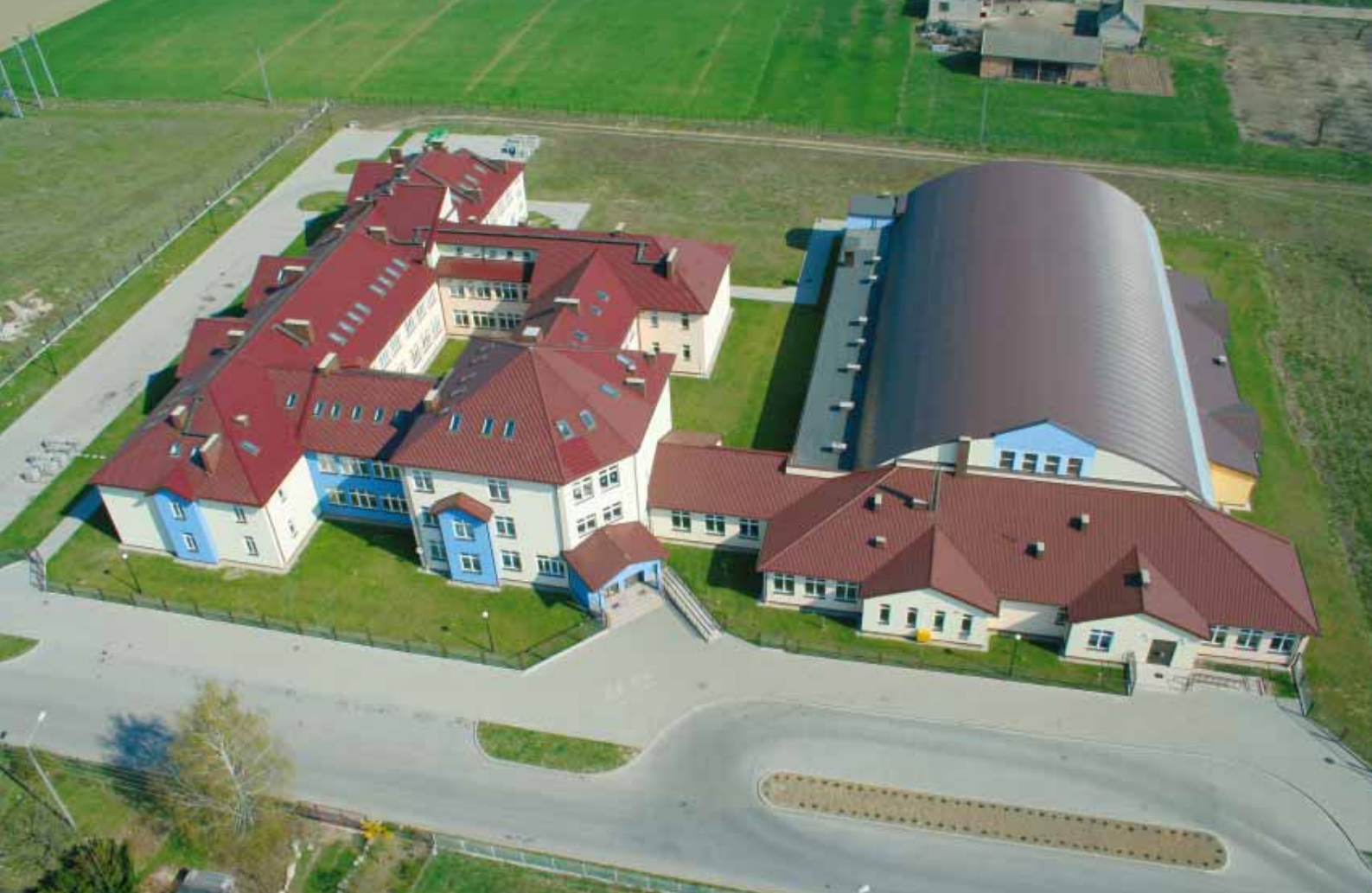
Zespół Szkół Gimnazjum i Liceum Ogólnokształcące w Tarczynie • Tarczyn High-school • Gymnasium in Tarczyn