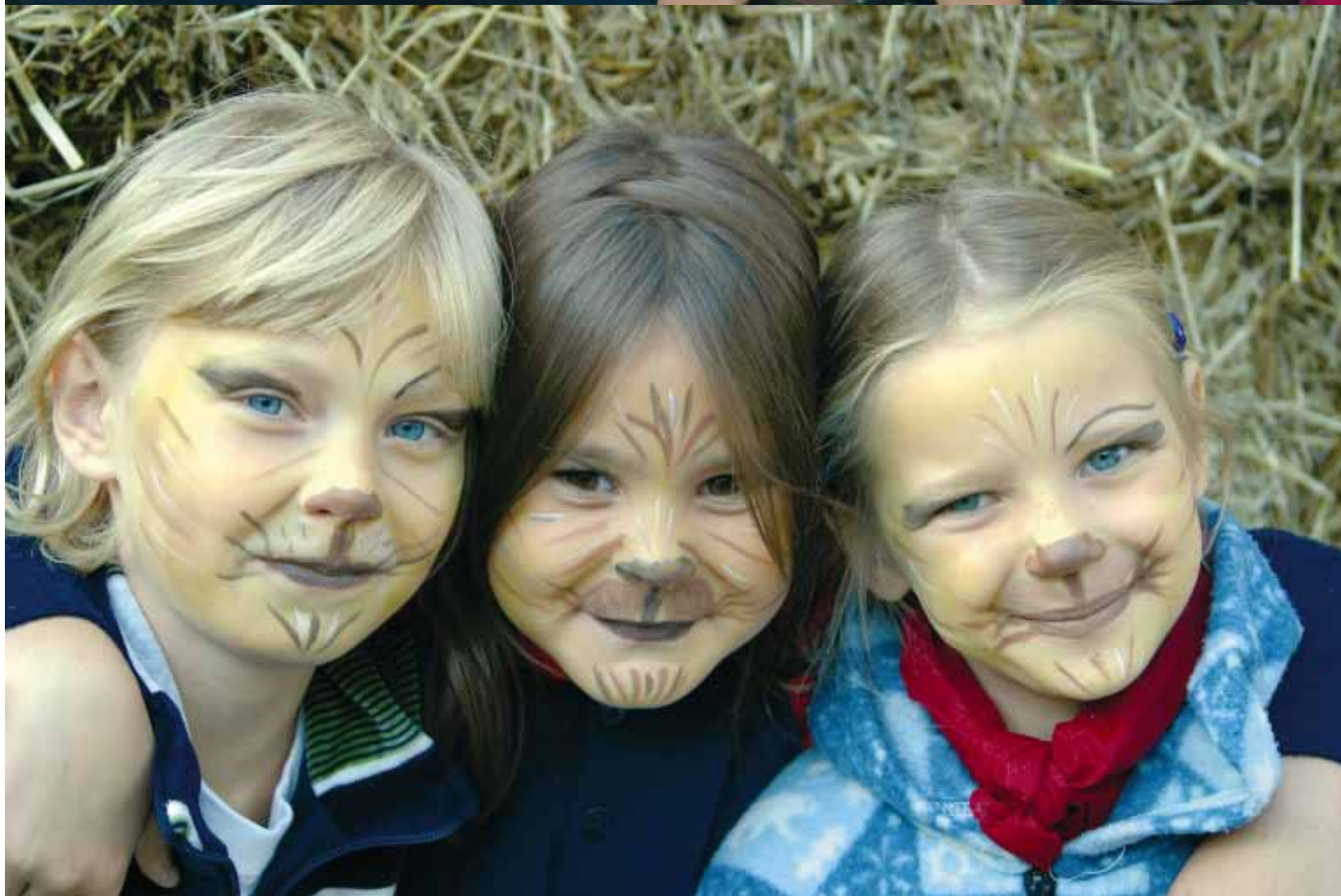
Nasze dzieci umieją się śmiać • Our children know how to laugh • Unsere Kinder können lachen