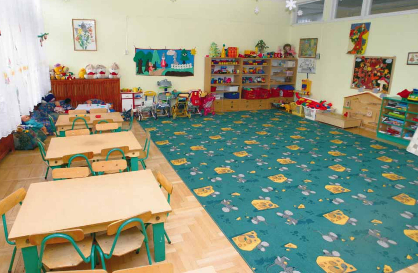
W nowych salach przedszkola jest nauka i zabawa • Play and learning in the nursery's / kindergarten's new classrooms • In den neuen Kindergartenräumen gibt's Platz für die Bildung und fürs Spielen