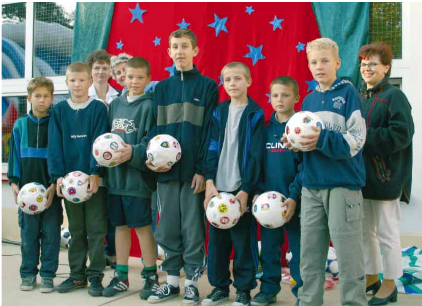
Nasi dzielni piłkarze • Our bold goalkeepers • Unsere Fußballspieler

Chóry szkolne są wspaniałą ozdobą każdej uroczystości • School choirs provide additional sparkle at special occasions and events •